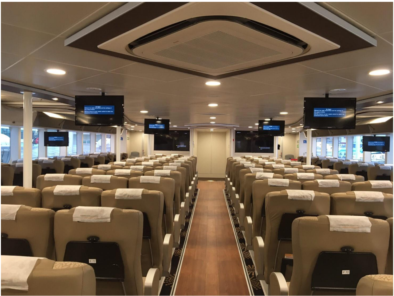
雲豹/藍鵲 客艙吧檯